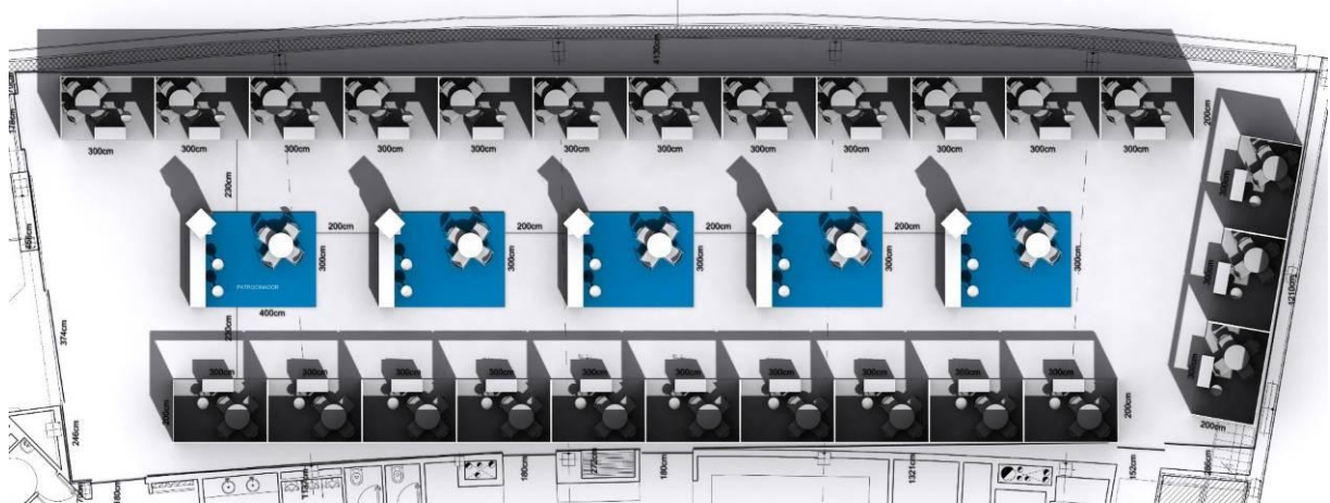
Disposición de la Muestra (sujeta a variaciones)